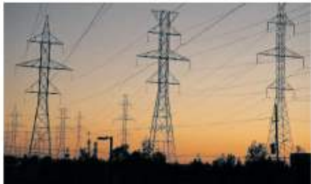
दौरान देश में बिजली की मांग 229 गीगावट तक पहुंचने का अनुमान

एजेंसी नई दिल्ली। देश में बिजली की खपत अप्रैल में सालाना आधार पर करीब 11 प्रतिशत बढ़कर 144.25 अरब यूनिट रही है। मुख्य रूप से तापमान बढ़ने से बिजली खपत बढ़ी है। सरकारी आंकड़ों से यह जानकारी मिली है। अप्रैल, 2023 में बिजली की खपत 130.08 अरब यूनिट थी। एक दिन में बिजली की अधिकतम मांग भी अप्रैल, 2024 में बढ़कर 224.18 गीगावट (एक गीगावट बराबर 1,000 मेगावट) हो गई, जबकि अप्रैल, 2023 में यह 215.88 गीगावट थी। बिजली मंत्रालय ने गर्मियों के दौरान बिजली की अधिकतम मांग लगभग 260 गीगावट रहे का अनुमान लगाया है। विशेषज्ञों ने कहा कि बिजली की खपत के साथ-साथ मांग में वृद्धि मुख्य रूप से तापमान बढ़ने और इस्पात तथा बिजली के क्षेत्रों में