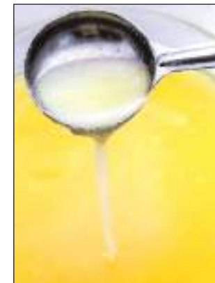
मिलावटी खाद्य पदार्थों पर संबंधित विभाग के द्वारा छापामार कार्रवाई की जाती है लेकिन इसका असर कुछ नहीं होता। मिलावटखोरों को

मिलावट 8 मिलावटी खाद्य पदार्थों पर संबंधित विभाग के द्वारा छापामार कार्रवाई की जाती है