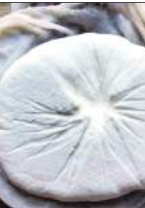
कोई रणनीति बनाने की भी जरूरत नहीं रही है, मजबूरी में लोग सस्ता सामान तलाशते हैं। पनीर 150 रुपये से 350 रुपये किलो तक

बाजार में मिल रहा है, लोग फर्क समझते हैं पर सस्ता खरीदते हैं। वहीं आम आदमी अपनी जेब के बोझ को कम करने के लिए सस्ते पनीर की ओर भागता है। वहीं घी में भी कई प्रकार की वैरायटी बाजार में हैं। बाजार में 600 रुपए किलो से लेकर 1200 रुपये किलो तक घी मिल रहा है। साथ ही कई प्रतिष्ठित कंपनियों के द्वारा हजार रुपये किलो तक घी का विक्रय किया जा रहा है, पूजा के नाम पर 200 से 250 रुपए किलो भी घी मिल जाता है। वहीं जब इस संबंध में गौ पालन करने वाले साधु महंत मोहिनी बिहारी शरण से बात की