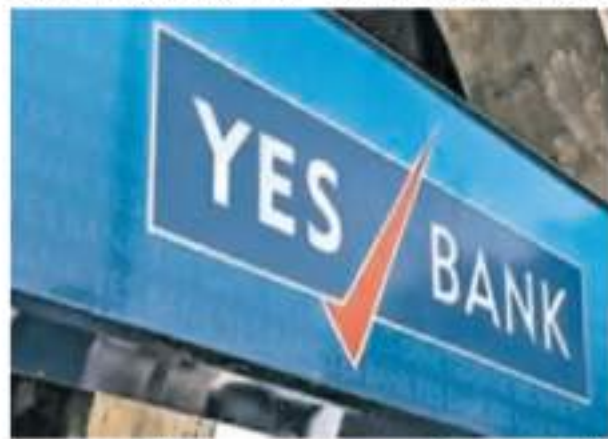
यस बैंक पर मणिपुर और पंजाब जीएसटी विभाग ने 6.87 लाख रुपये का लगाया जुर्माना

एजेंसी नई दिल्ली। देश में बिजली की खपत अप्रैल में सालाना आधार पर करीब 11 प्रतिशत बढ़कर 144.25 अरब यूनिट रही है। मुख्य रूप से तापमान बढ़ने से बिजली खपत बढ़ी है। सरकारी आंकड़ों से यह जानकारी मिली है। अप्रैल, 2023 में बिजली की खपत 130.08 अरब यूनिट थी। एक दिन में बिजली की अधिकतम मांग भी अप्रैल, 2024 में बढ़कर 224.18 गीगावट (एक गीगावट बराबर 1,000 मेगावट) हो गई, जबकि अप्रैल, 2023 में यह 215.88 गीगावट थी। बिजली मंत्रालय ने गर्मियों के दौरान बिजली की अधिकतम मांग लगभग 260 गीगावट रहे का अनुमान लगाया है। विशेषज्ञों ने कहा कि बिजली की खपत के साथ-साथ मांग में वृद्धि मुख्य रूप से तापमान बढ़ने और इस्पात तथा बिजली के क्षेत्रों में