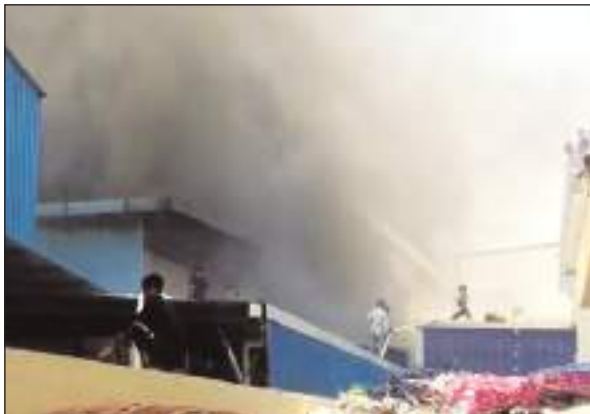
बहादुरगढ़ के सेक्टर-17 औद्योगिक क्षेत्र में सुबह 10 बजकर 50 मिनट पर एचएसआईडीसी सेक्टर-17 में स्थित फैक्टरी संख्या 218 और

झज्जर/टीम एक्शन इंडिया बहादुरगढ़ के सेक्टर-17 स्थित फुटवियर की दो फैक्टरियों में गुरुवार की सुबह आग लगने से लाखों का नुकसान हो गया है। बहादुरगढ़ के अलावा रोहतक व दिल्ली से आई दमकल टीमों ने आठ घंटे की कड़ी मशकत के बाद आग पर काबू पाया जा सका आग लगने के कारण पता नहीं चल सका है।