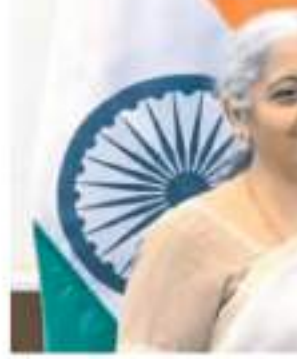
सीमा शुल्क बोर्ड (सीबीआईसी), राजस्व विभाग, राज्य और केंद्र

एजेंसी नई दिल्ली। केंद्रीय वित्त मंत्री निर्मला सीतारमण ने यह भी कहा कि आईजीएसटी (एकीकृत जीएसटी) निपटान को लेकर राज्यों का कोई ककाया नहीं है। गौरतलब है कि अप्रैल महीने में जीएसटी राजस्व संग्रह सालाना आधार पर 12.4 फीसदी उपलब्ध 2.10 लाख करोड़ रुपये के रिकॉर्ड स्तर पर पहुंच गया है। देश में जीएसटी एक जुलाई, 2017 से लागू हुआ था। वर्तमान में जीएसटी प्रणाली पर पंजीकृत करदाताओं की संख्या 1.45 करोड़ है।