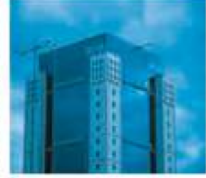
अमेरिकन एक्सप्रेस गुरुग्राम में 10 लाख वर्ग फुट क्षेत्र में खोलेगी अत्याधुनिक कार्यालय परिसर

करने के लिए आपूर्ति जून में 224.1 गीगावट की नई कंघाई पर पहुंच गई। लेकिन जुलाई में यह घटकर 209.03 गीगावट पर आ गई। अगस्त, 2023 में अधिकतम मांग 238.82 गीगावट तक पहुंच गई, जबकि सितंबर में यह 243.27 गीगावट, अक्टूबर में 222.16 गीगावट, नवंबर में 204.77 गीगावट, दिसंबर, 2023 में 213.79 गीगावट, जनवरी, 2024 में 223.51 गीगावट और फरवरी, 2024 में 222.72 गीगावट थी। उद्योग विशेषज्ञों ने कहा कि व्यापक स्तर पर बारिश के कारण 2023 में मार्च, अप्रैल, मई और जून में बिजली की खपत प्रभावित हुई। उन्होंने कहा कि अगस्त, सितंबर और अक्टूबर में बिजली की खपत बढ़ी। इसका मुख्य कारण गर्मी बढ़ने और त्योहारों से पहले औद्योगिक गतिविधियों में तेजी थी।