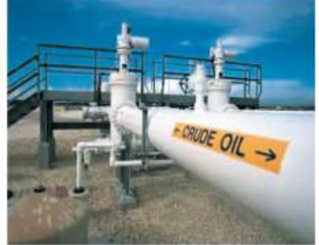
घर कर लगाते हैं। दरअसल, सरकार अंतरराष्ट्रीय बाजार में कच्चे तेल की पिछले दो

भारत उन देशों में शामिल हो गया, जो ऊर्जा किराये के असाधारण लाभ हफ्तों की औसत कोमतों के आधार पर टैक्स दरों की समीक्षा हर पखवाड़े करती है। यह कर विशेष अतिरिक्त उत्पाद शुल्क (एसएईडी) के तौर पर लगाया जाता है।